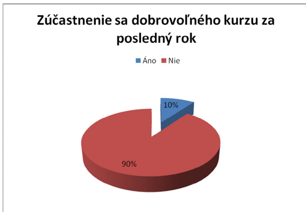
Graf 2 Dobrovoľné kurzy